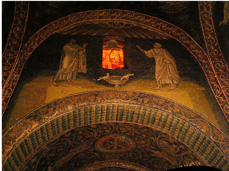
Illustration 1: Galla Placidias mausoleum